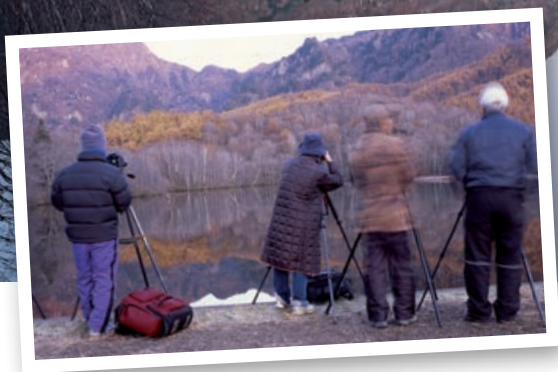
Dieser Bergsee bei Nagano gilt noch immer als Geheimtipp – auch wenn er im November allmorgendlich von mehreren Fotografen aufgesucht wird (kleines Bild). Sie alle wollen das leuchtende Herbstlaub vor der beeindruckenden Bergkulisse im Bild festhalten.