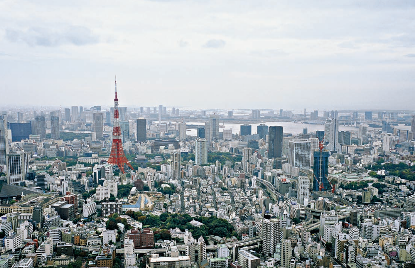
Von dem 238 Meter hohen Mori Tower gelang Micha Pawlitzki diese stimmungsvolle Panorama-Aufnahme Tokios. Er hatte eine Genehmigung eingeholt, um sein Stativ auf der Aussichtsplattform aufbauen zu dürfen. Trotzdem musste alles schnell gehen, erinnert er sich. „Denn trotz Erlaubnis hatte ich nur eine Minute Zeit, um das Bild zu machen.“