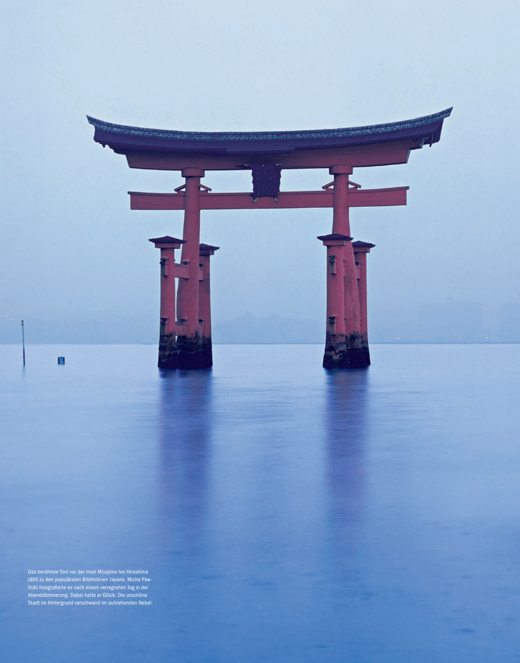
Das berühmte Torii vor der Insel Miyajima bei Hiroshima zählt zu den populärsten Bildmotiven Japans. Micha Pawlitzki fotografierte es nach einem verregneten Tag in der Abenddämmerung. Dabei hatte er Glück: Die unschöne Stadt im Hintergrund verschwand im aufziehenden Nebel.